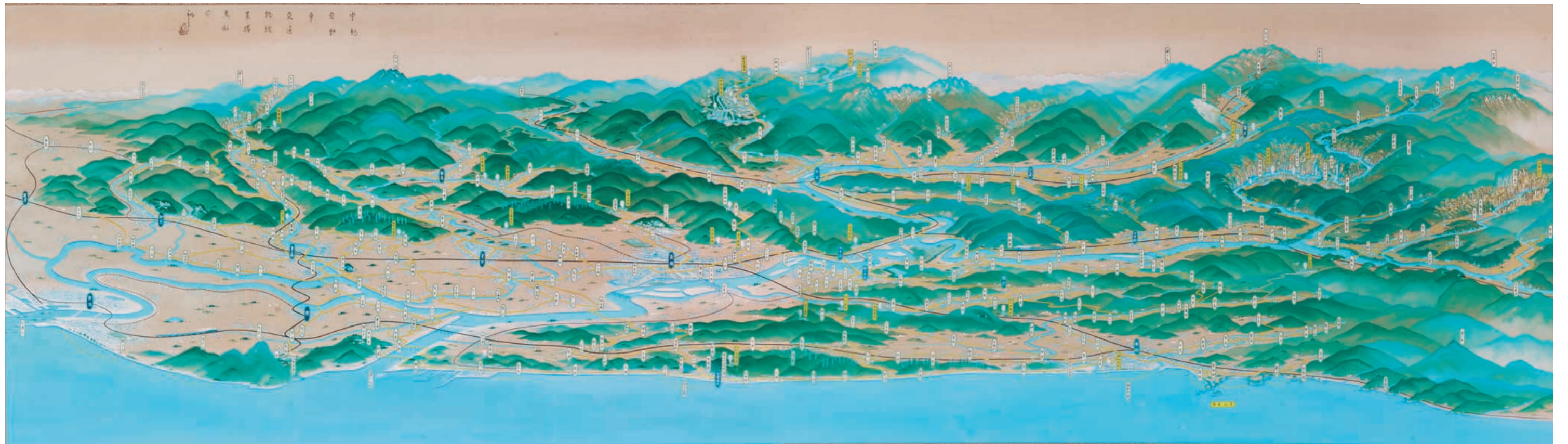
図1「中越自動車 交通路線景勝鳥瞰図」越後交通株式会社 所蔵