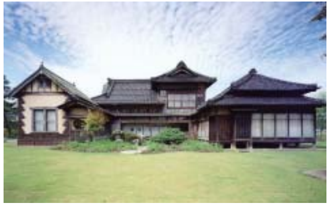
応接棟、主屋棟、寝室棟